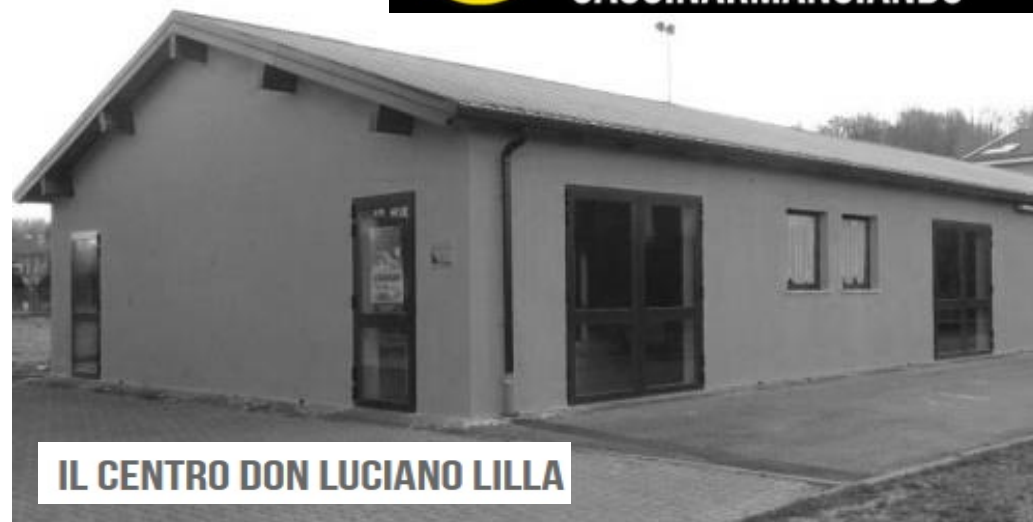
IL CENTRO DON LUCIANO LILLA

Alzheimer Café è un luogo d'incontro informale per trascorrere un pomeriggio in un'atmosfera accogliente e rilassata, dove poter condividere le difficoltà e le problematiche legate alla malattia di Alzheimer e creare una rete di solidarietà e di amicizia tra le famiglie, per sentirsi meno soli e sconfiggere la sensazione di impotenza e smarrimento.