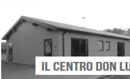
IL CENTRO DON LUCIANO LILLA